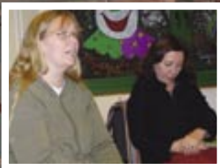
Runder Tisch Lurup 21. Februar 2008