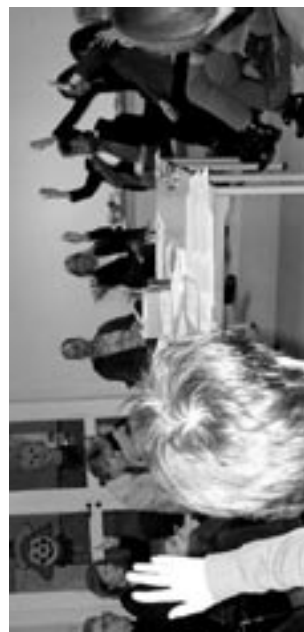
Große Zustimmung für das Projekt connect beim Runden Tisch Gesundheitsförderung Lurup am 21.2.08.

Die Geschäftsstelle für Gesundheitsförderung wird gemeinsam alle, die ein Projekt zur Gesundheitsförderung im Stadtteil auf den Weg bringen wollen, weiter beraten und dabei unterstützen, geeignete Fördermöglichkeiten zu finden. Weitere Runden Tische Gesundheitsförderung sind geplant. Wer Interesse hat mitzuarbeiten, kann sich gerne an die Geschäftsstelle für Gesundheitsförderung, Stadtteilhaus Lurup, Boverstand 38, 22547 Hamburg, Tel. 87 97 41 16 wenden. w/v