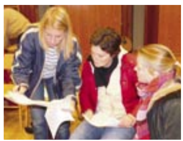
Runder Tisch Lurup 12. November 2007