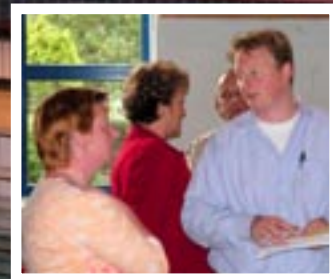
Runder Tisch Lurup 12. September 2007