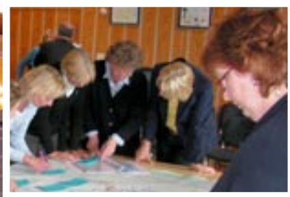
Gemeinsam Gesundheit fördern am Lüdersring, 9. Mai 2007