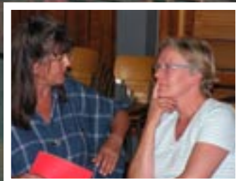
Runder Tisch Flüsseviertel 14. Juni 2007