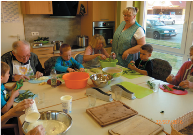
Generationsübergreifendes Projekt „Junges Gemüse trifft auf reifes Obst“