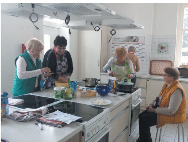
„Wir wollen uns etwas Gutes tun“

Die Beispiele belegen außerdem eindrucksvoll das thematisch breite Spektrum der vorhandenen Aktivitäten. Von der Senioreneinrichtung, die gemeinsam mit den Angehörigen ihrer Bewohnerinnen und Bewohner Kochnachmittage veranstaltet hin zu bürgerschaftlichen Ehrenamtsinitiativen, die sich durch die Kommune unterstützt regelmäßig im örtlichen Gemeindehaus treffen. Das Thema „Gemeinsam essen im Alter“ zeigt sich generell als eines, dem großes Potenzial innewohnt. Das Leben vor Ort lässt sich (noch) lebenswerter gestalten, indem Menschen auch über das Essen am Gemeinwesen beteiligt und miteinander in den Austausch gebracht werden. Stationäre und mobile Essensversorgung sind wichtige Faktoren moderner, alternder Gesellschaften. Dennoch sind sie eher deaktivierend