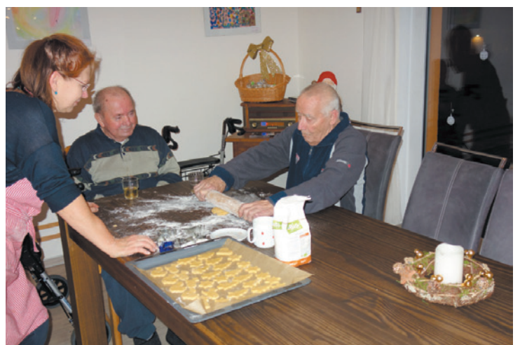
Projekt einer stationären Einrichtung „Gemeinsames Kochen in Senioren-Wohngemeinschaften“