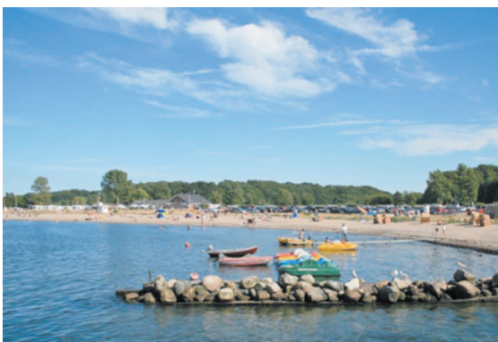
Strand Langballigau

Die Region wird überwiegend von Gästen aus der ganzen Bundesrepublik und aus Dänemark als Naherholungsgebiet genutzt. Sehr geschätzt werden sowohl die gut geführten und historisch sanierten Gasthöfe, der Hafen, die Hotels und Campingplätze als auch das insgesamt vielfältige