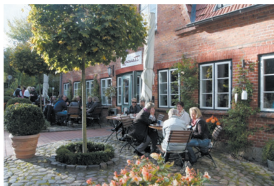
Museumsgäste und Publikum vor dem Landhaus Unewatt