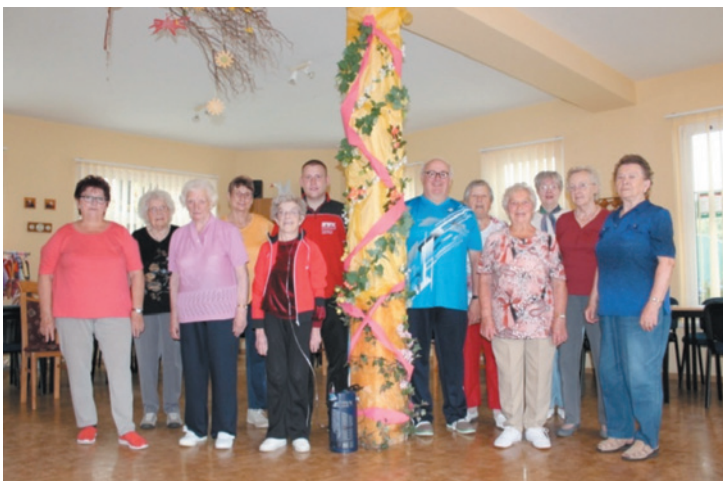
In Gemeinschaft einmal pro Woche mit Übungsleiter für den Alltag üben

Inhaltlich geht es in der Sturzprävention um die Durchführung koordinativer Übungen, die entscheidend auf die Erhaltung und Stabilisierung