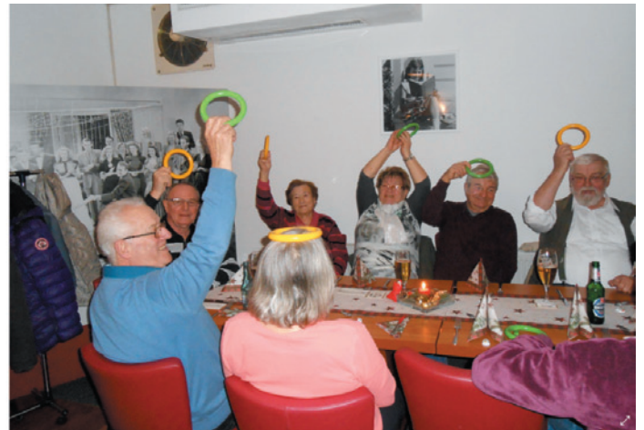
Kooperationsprojekt „Gemeinsam schmeckt es besser“ und „Lange mobil und sicher zu Hause“