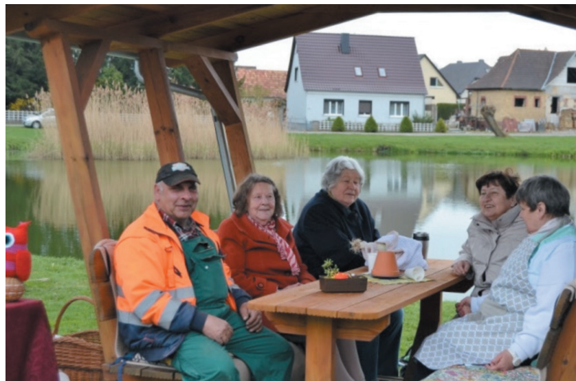
Wochenmarkt, Gemeinde Podelzig

Das Angebot kann eine Anlaufstelle für Jung und Alt mit zu reparierenden Dingen darstellen und generiert damit auch einen Mehrwert.