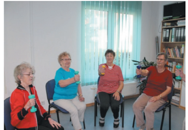
Gleichgewichts- und Kräftigungsübungen als Teil der Sturzprävention

Die erste Zielsetzung in Abstimmung mit dem Landkreis sah die Entstehung von fünf dieser speziellen Gruppen im Jahr 2015 vor. Gegenwärtig trainieren bereits 430 Seniorinnen und Senioren kreisweit in 36 Sportgruppen regelmäßig einmal pro Woche. Aufgrund des positiven Zuspruchs sowie weiterhin steigender Nachfrage und Beteiligung im gesamten Kreisgebiet konnten weitere Netzwerkpartnerinnen und -partner wie Sportvereine, die Rheumaliga und ehrenamtliche Übungsleitende für die Absicherung und Betreuung der Sportgruppen gewonnen werden.