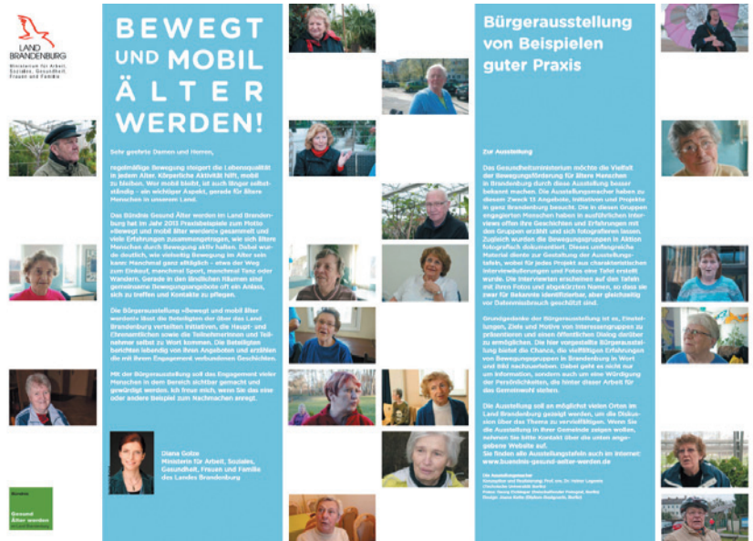
Ein Beispiel der insgesamt 15 Ausstellungstafeln der Bürgerausstellung „Bewegt und mobil älter werden“

Der Blick über die eingereichten Angebote zeigt, dass Bewegungsförderung ein wichtiger, aber nicht entscheidender Grund für ältere Menschen ist, aktiv an Bewegungsangeboten teilzunehmen. Mindestens ebenso wichtig ist es ihnen, gemeinsam Zeit zu verbringen und Kontakte zu pflegen. Die Angebote leisten damit auch einen wichtigen Beitrag zur sozialen Einbindung der älteren Menschen an ihren jeweiligen Wohnorten. Dieser Aspekt wird auch in einer landesweiten Bürgerausstellung herausgestellt, die im Anschluss an die Sammlung und die Auszeichnung der Preisträger entwickelt wurde. Diese aus 15 Tafeln bestehende Ausstellung stellt die 12 Preisträger der Sammlung in Originalzitate der Initiatorinnen und Initiatoren und Beteiligten vor Ort vor. Zwischen der Vernissage im Juni 2014 und Januar 2018 wurde die Ausstellung an 28 Orten im Land Brandenburg gezeigt – in Landratsämtern, Stadtverwaltungen, Stadtteilhäusern oder Volkshochschulen, oft verbunden mit thematischen Veranstaltungen oder im Rahmen von Seniorenwochen. Begleitend zur Ausstellung bot die Fachstelle Gesundheitsziele in Zusammenarbeit mit den lokalen Akteuren die Möglichkeit an, sich im Rahmen eines halbtägigen „Transfertages“ über Erfahrungen in der Umsetzung von Bewegungsangeboten für ältere Menschen auszutauschen.