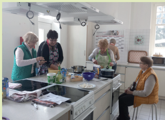
Gesundheit Berlin-Brandenburg e. V.