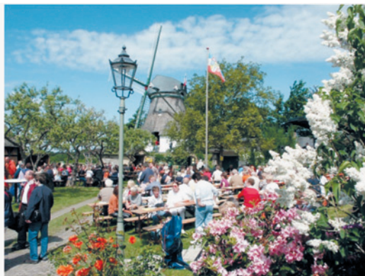
Mühle Hoffnung, Munkbrarup