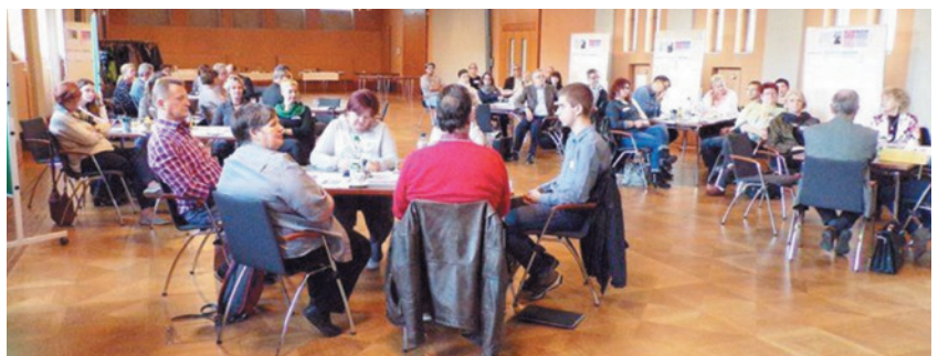
Dialogwerkstatt zu Seniorenangeboten in den Stadtteilen, 11.10.2017

Die Stadt Brandenburg an der Havel hat es sich deshalb zur Aufgabe gemacht, Selbständigkeit und Lebensqualität bis ins hohe Alter zu fördern und zu erhalten. Den älteren Menschen soll eine selbstbestimmte Lebensweise und gesellschaftliche Teilhabe ermöglicht werden. Ziel dabei ist, die wohnortnahe Versorgung im gesamten Stadtgebiet zu erreichen, vorhandene Strukturen einzubinden und zu stärken sowie das bürgerschaftliche Engagement zu erweitern. Insbesondere die Versorgungsangebote innerhalb der Stadtteile und Wohngebiete sollen so entwickelt werden,