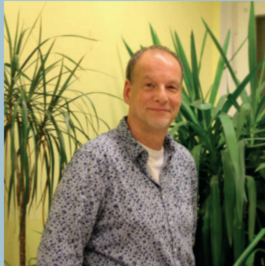
Text und Foto: Carla Miranda

Im MehrGenerationenHaus Wassertor (MGH) treffen sich Menschen aus dem Wassertor-Kiez und der Umgebung. Egal, ob jung oder alt, hier finden Nachbar*innen zusammen, um Kurse zu besuchen, sich von den Mitarbeitenden beraten zu lassen oder einfach um mit anderen Menschen zusammen zu sein. Hier darf sich jede*r wie zuhause fühlen.